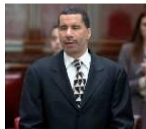
David Paterson Gob NY